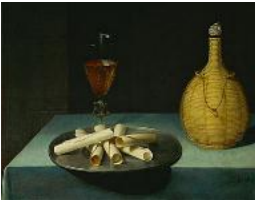
Lubin Baugin Le Dessert de gaufrettes (vers 1640)

Elle porte par défaut sur l'ensemble des textes de [Louvre.edu], mais il est possible de la restreindre à certains types de textes : feuillets, notices d'œuvres, dictionnaires, biographies.