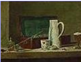
Pipes et vase à boire, vers 1750

Un exemple de recherche simple sur un auteur : Jean-Baptiste Siméon Chardin.