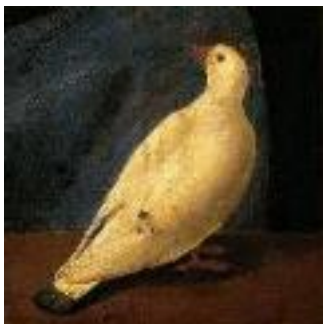
Piero di Lorenzo, dit Piero di Cosimo La Vierge et l'Enfant à la colombe

L'index thématique permet de rechercher les œuvres portant sur un personnage ou une scène mythologique, un événement historique, de regrouper les œuvres appartenant à un genre particulier (nature morte, portrait) ou illustrant une figure (allégorie). Cet index est dynamique et correspond aux œuvres du/des département(s) du Louvre sur lesquels porte la recherche.