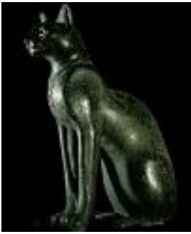
Le Chat Basse époque, 664-332 av. J.-C.

détail du tableau ( La marchande de fruits et de légumes de Louise Moillon, La raie de Jean-Baptiste-Siméon Chardin).